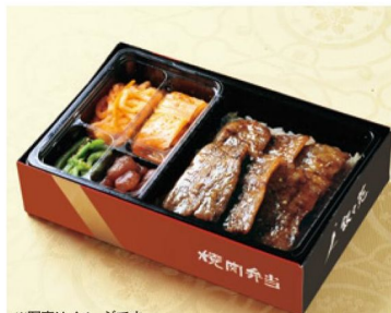
※写真はイメージです。 付け合わせのお惣菜は変更になる場合がございます。